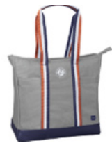
Tasche Team Tote