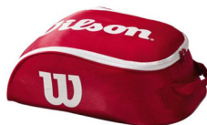
Tour Shoe IV Bag