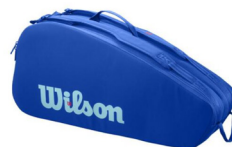
Ultra Tour-6R Bag