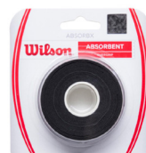
ABSORBX OVERGRIP 3 PACK Black