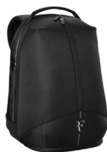
Roger Federer Backpack