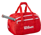
Small Duffel Bag Red